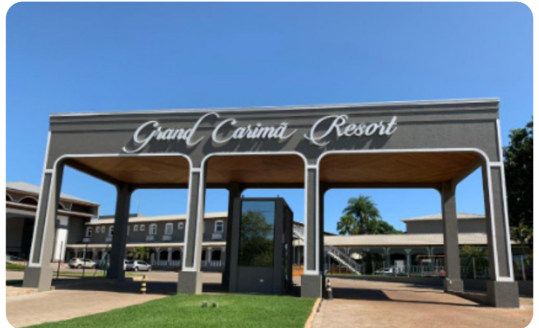
TABELA HOSPEDAGEM - PARTICIPANTES (GRAND CARIMÃ)